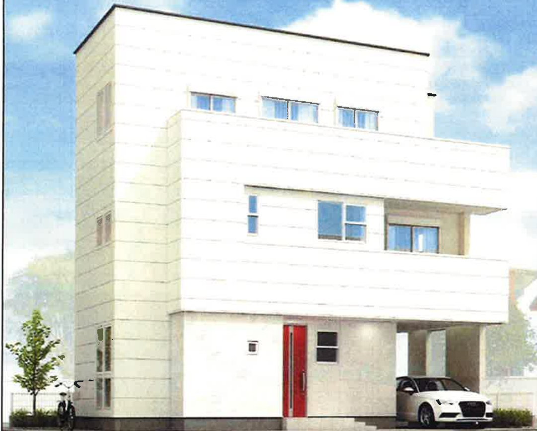
このパースはイメージで現況とは異なります。現況と異なる場合は現況を優先します。