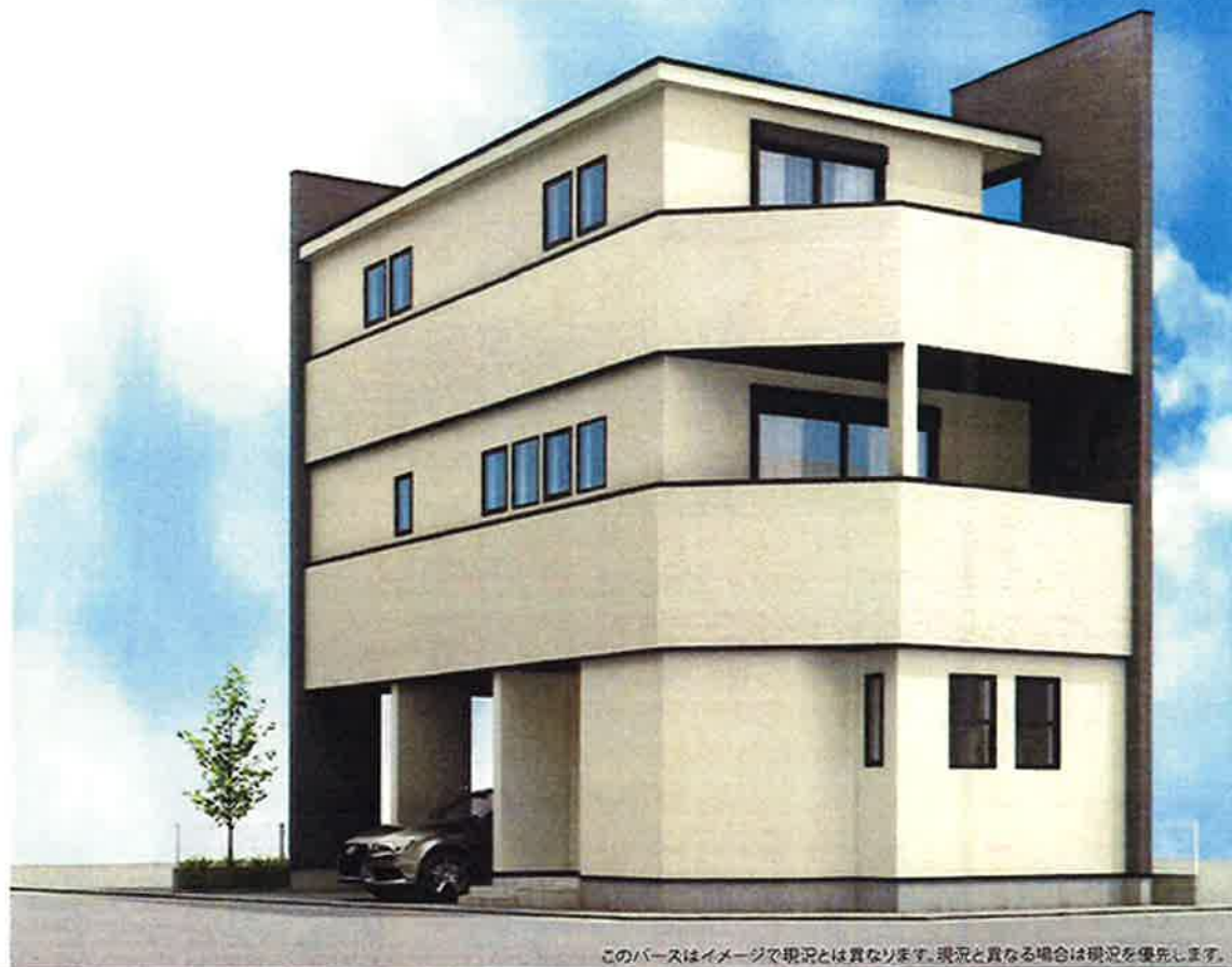
このパースはイメージで現況とは異なります。現況と異なる場合は現況を優先します。

愛知県知事 (3) 21076号 (社)愛知県宅地建物取引業協会会員 (社)全国宅地建物取引業保証協会会員 〒467-0877 名古屋市瑞穂区雁道町1丁目8番地 みずほビル2F