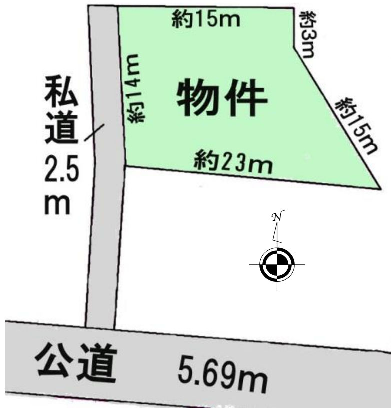
【地形図】 ※地形図は概略のため現況を優先してください。